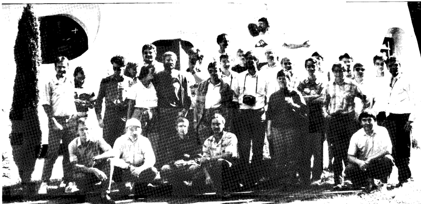
Figure 2: Groepsfoto van de deelnemers aan het IMC'91, met op de achtergrond de voet van de Einsteinturm.